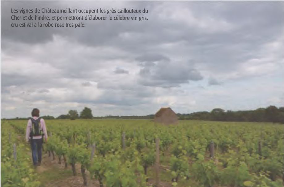
Les vignes de Châteaumeillant occupent les grès caillouteux du Cher et de l'Indre, et permettront d'élaborer le célèbre vin gris, cru estival à la robe rose très pâle.

Passé Verneuil-sur-Igneraie, le bocage reprend doucement ses droits et l'on pense une ultime fois à George Sand, qui sentant sa fin venir, se fit transporter devant sa fenêtre. « Laissez verdure » auraient été ses derniers mots. Force est de reconnaître que quelque 130 années plus tard, les vœux de la romancière ont pleinement été entendus...*