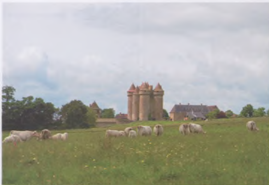
C'est au château de Sarzay construit au 14 e siècle, que George Sand situe l'intrigue de son roman Le meunier d'Angibault .