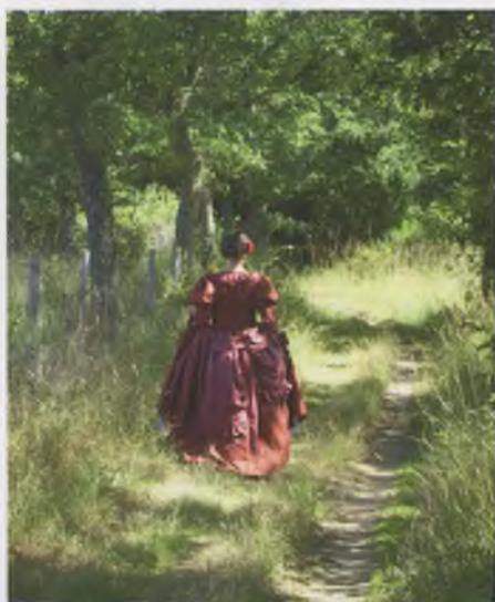
Les chemins creux du Berry et de la Vallée noire sont presque inchangés depuis l'époque de George Sand.

PRAIRIES, RIVIÈRES, VERTS PÂTURAGES ET FORÊTS, LE BOISCHAUT BERRICHON EST UNE CONTRÉE ENCORE TRÈS RURALE OÙ LE BOCAGE EST ROI, BREF UNE AUBAINE POUR LES RANDONNEURS. EMPRUNTONS LE GR® DE PAYS DES MAÎTRES SONNEURS, POUR UNE BOUCLE DE 142 KM SUR LES TRACES DE GEORGE SAND.